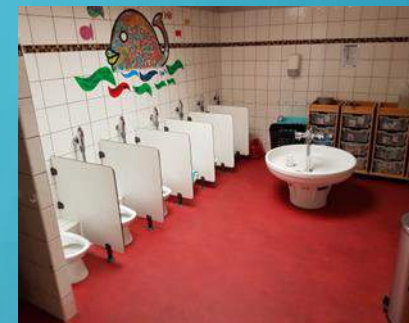
Espace de change / WC

Nous encourageons chaque enfant à aller chercher ses vêtements dans son panier personnalisé et à faire seul, nous lui montrons comment faire et lui proposons notre aide s'il a besoin. Certains enfants ne veulent pas, alors il n'est pas nécessaire d'insister, parfois il a juste besoin que l'on s'occupe de lui.