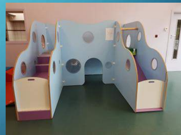
Toboggan espace de vie moyens/grands

L'aménagement de la pièce de vie est pensé pour que l'enfant puisse jouer librement, développer son autonomie, son imaginaire, sa créativité. Un espace cuisine, un espace motricité avec un toboggan et des modules, un espace voitures, un espace construction et un espace ressourcement avec des tapis coussins et fauteuils ont été aménagés que chaque enfant peut investir et explorer à sa manière et à son rythme. Pour 2023/2024, nous souhaitons mettre en place un espace manipulation et un espace graphique.