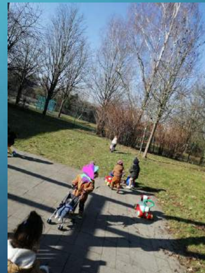
Sortie quotidienne au jardin

Pour 2023/2024, nous souhaiterions développer nos actions autour du jardin : créé un jardin partagé, mise en place de bacs jardinages et développer les ateliers parents/enfants autour de cette thématique, créer des espaces de jeux à l'aide d'objets recyclés (mur musical, parcours de pneus ...)