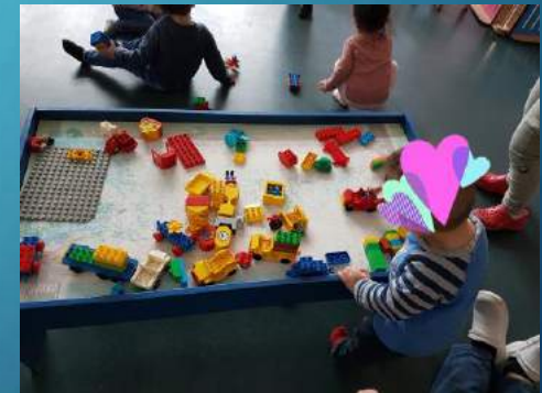
Jeux de construction