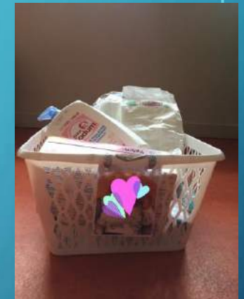
Panier de change individualisé