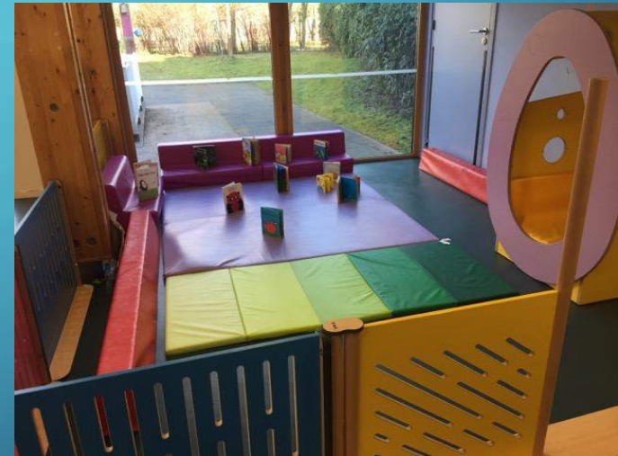
Zoom sur l'espace ressourcement salle de vie moyens/grands

Le mobilier de la crèche est sélectionné avec soin auprès de fournisseurs spécialisés Petite Enfance. En effet, ce choix nous apporte la garantie de matériaux de qualité, une sécurité optimale et du mobilier parfaitement adapté et confortable pour les enfants et les professionnels.