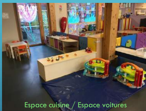
Espace cuisine / Espace voitures

L'aménagement de la pièce et les différents espaces sont propices aux jeux et aux échanges entre les enfants.