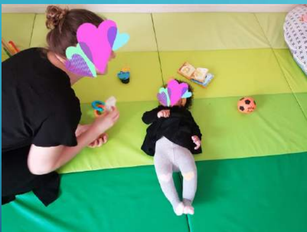
Laisser l'enfant se mouvoir librement

« La motricité libre », un concept essentiel à notre pratique qui consiste à laisser libre cours à tous les mouvements spontanés de l'enfant. C'est-à-dire qu'on ne place pas un enfant dans une position qu'il n'a pas acquis par lui-même (par exemple on ne le met pas assis, s'il ne se met pas assis seul, de même les transats sont utilisés avec parcimonie : pour la digestion par exemple). Ainsi on respecte son rythme et les étapes de son développement psychomoteur.